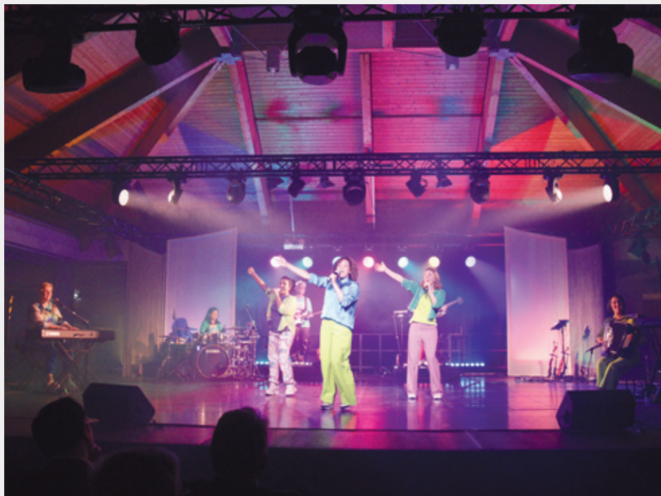
Künstler:innen von GenVerde während des Konzerts auf der Bühne der Heinrich-Heine-Realschule in Hagen.

„Mit dem Projekt möchten wir die Jugendlichen ermutigen, ihr Leben in