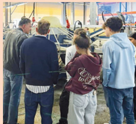
Jugendliche beim Unternehmensbesuch bei Art Worx.

sowie dem Betrieb vor Ort, der „Art Worx Merchandising GmbH“. So erhalten die Schüler:innen die Möglichkeit, sich selbst als unternehmerisch tätige Individuen zu erleben und gleichzeitig wichtige soziale Kompetenzen wie vertrauensvolle Zusammenarbeit in der Gruppe zu stärken. Die Schüler:innen haben bereits erste Prototypen ihrer selbst konzipierten Flaschenöffner gefertigt und gehen nun im neuen Schuljahr in die Kundenakquise und Verkaufsphase. Ohne die finanzielle Unterstützung der ProFiliis-Stiftung und der Dortmunder Wirtschaftsförderung wäre die Realisierung des Projekts so nicht möglich gewesen.