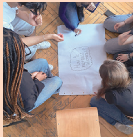
Jugendliche aus beiden Ländern bei einer Kleingruppenarbeit zum Thema Toleranz.

Das Projekt wird durch das Deutsch-Polnische Jugendwerk im Rahmen des Sonderprogramms „Wege zur Erinnerung“ und durch den Kinder- und Jugendförderplan des Landes Nordrhein-Westfalen unterstützt.