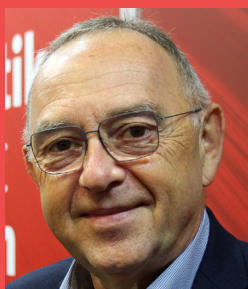
Dr. Norbert Walter-Borjans